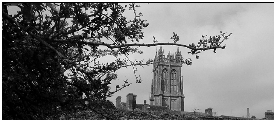
St John's Church, Glastonbury

The simplified map above covers exactly the same area as the facing map but only shows more or less those roads selected for the map page 4 of the 1979 guide Glastonbury by Michael Mathias so as to have space to indicate some of the places mentioned in A Glastonbury Romance . In the novel, Wearyall Hill is called "Wirral Hill", which would seem to derive from the large area just to the North of it named "Wirral Park" on the Ordnance Survey map.